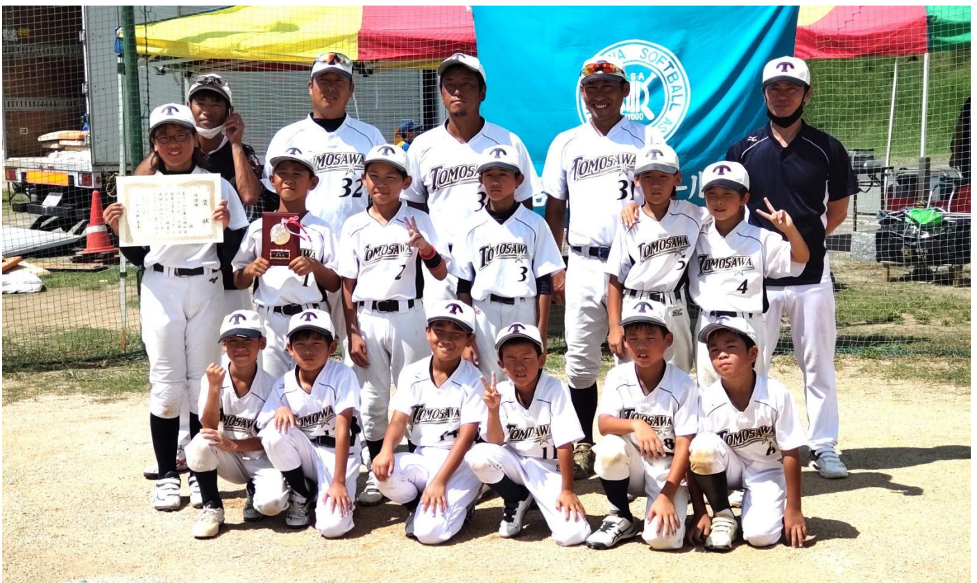
準優勝 友沢ソフトボール